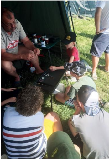
84 Polovníctvo a rybárstvo 7/24

Jednou z deklarovaných priorit Slovenského rybárskeho zväzu je výchova novej generácie rybárov. Prírodzene, tak sa udržiava životaschopnosť členskej základne a je predpoklad, že mladá časť prezemia zodpovednosť za riadenie moderného rybárstva v jednotlivých regiónoch. O mnohých podujatiach pre deti a mládež, najmä o rôznych pretekoch, sa zdieľame na stránkach časopisu POLOVNÍCTVO A RYBÁRSTVO . Aká je to však s výchovou tých, ktorí sú, takpovediac, na začiatku cesty?