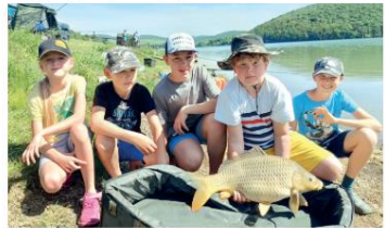
Polovníctvo a rybárstvo 7/24 85